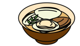
はまぐりのお吸い物

3月3日は「ひな祭り」。女の子の健やかな成長を願ってお祝いをする日本の伝統行事です。現在のように、ひな人形を飾ようになったのは江戸時代のことで、もとは人形を身代わりにして邪気をはらう「流しびな」が起源とされます。行事食として、ちらしずし、はまぐりのお吸い物、ひしもち、ひなあられなど、華やかな食べ物並びます。